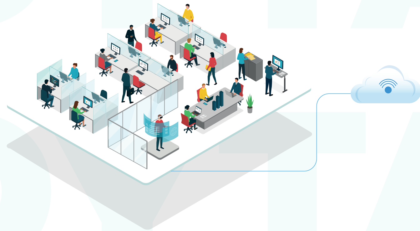
EM AMBIENTE CLOUD, CONTROLADO PELO CLIENTE