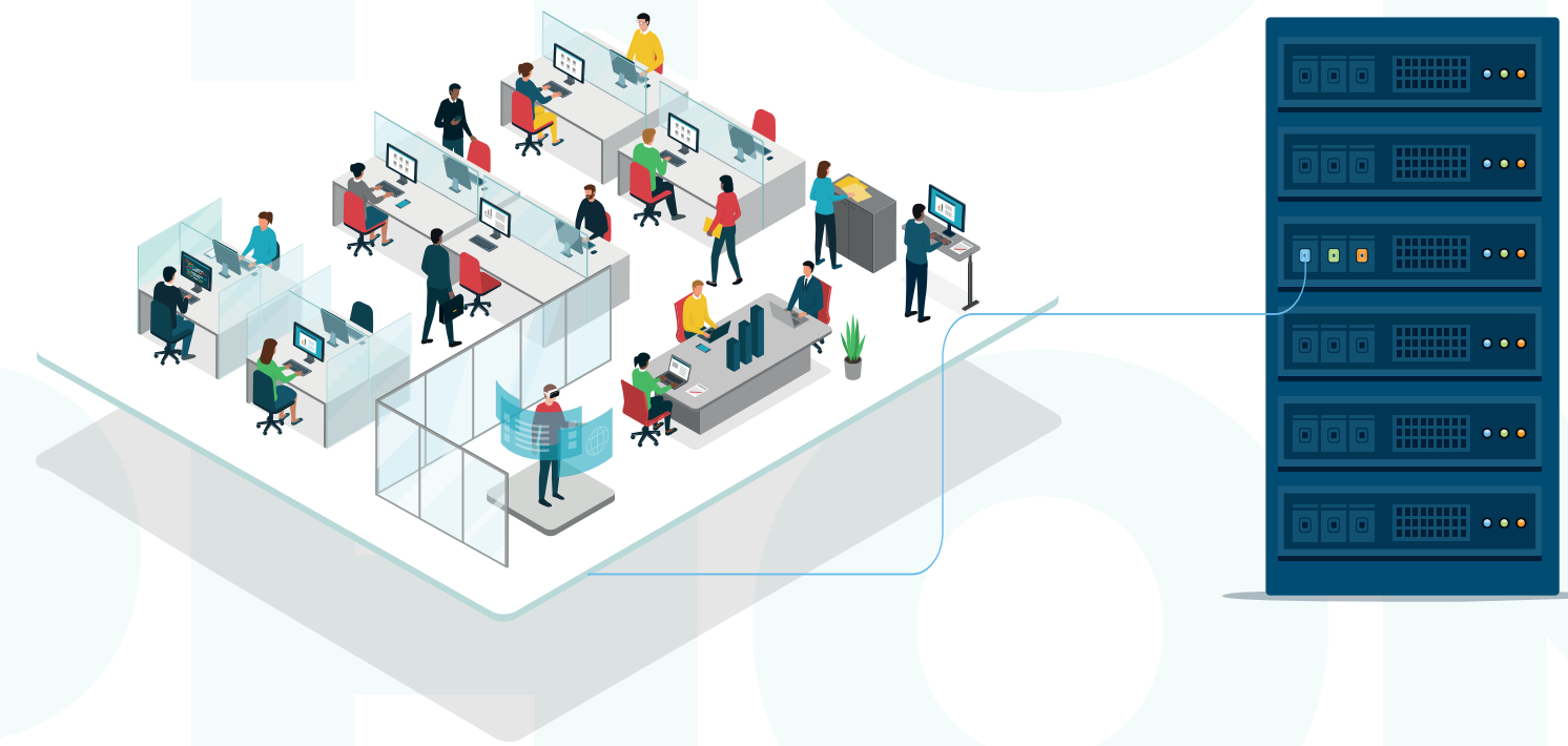
SERVIDOR INSTALADO NO PRÓPRIO DATACENTER DA ORGANIZAÇÃO (ON-PREMISES)